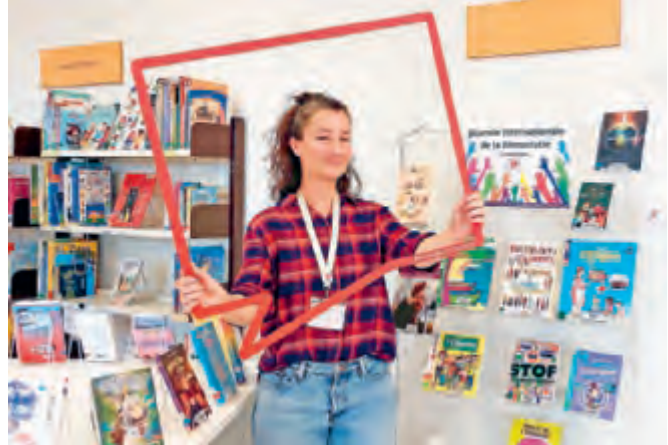
Tag der Demokratie in der Stadtbibliothek Prilly (VD)

Demokratie lebt von Teilhabe – und Bibliotheken leisten dazu einen wichtigen Beitrag. Sie garantieren freien Zugang zu Wissen, ermöglichen Orientierung in einer komplexen Informationswelt und schaffen Räume für Austausch, Reflexion und Meinungsbildung.