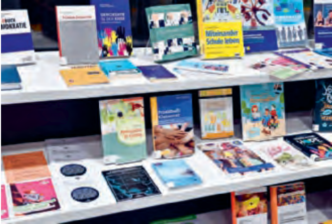
Demokratie-Medienausstellung an der PH St. Gallen

LEANDRA HILDBRAND, PROJEKTLEITERIN CAMPUS DEMOKRATIE