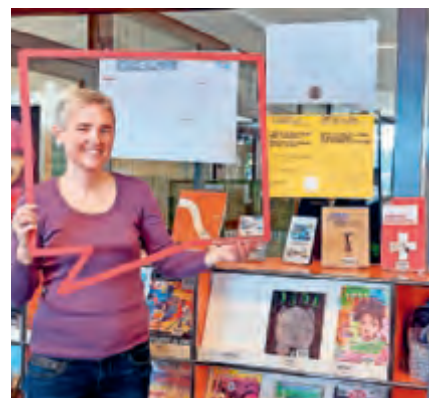
Journée de la démocratie à la bibliothèque de l'établissement primaire et secondaire de l'Élysée à Lausanne

Découvrez idées et ressources: www.journeedelademocratie.ch