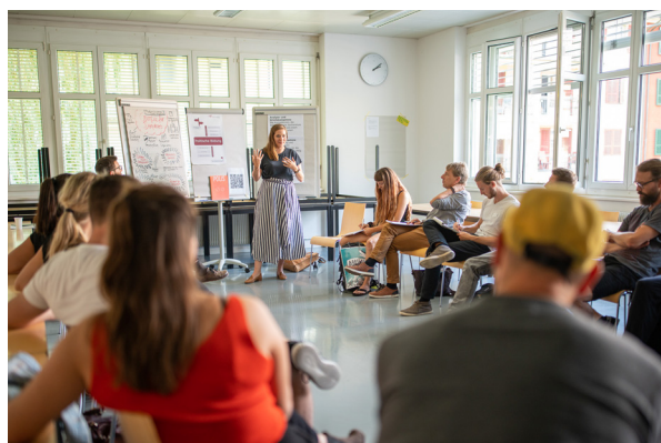
Atelier pour les animateur-trice-s jeunesse chez voja le 29 août à Berne