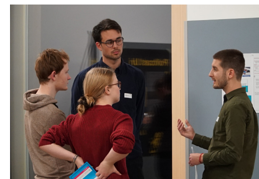
Soirée de réseautage le 18 novembre à Altdorf