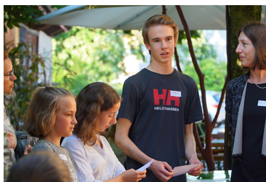
Soirée de réseautage le 17 juin à Frauenfeld