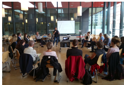
Atelier en collaboration avec le DIP le 2 octobre à Genève