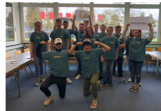
Atelier pour les jeunes dans le cadre de Step Into Action le 13 / 14 novembre à Berne