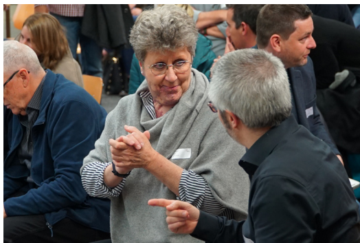
Soirée de réseautage le 3 avril à Sion