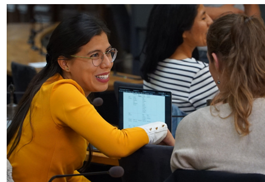
Soirée de réseautage le 3 octobre à Lausanne