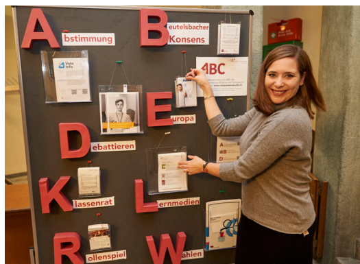
Stand lors de la journée bernoise de l'éducation le 14 mai à Bienne et lors des 100 ans de Carl Spitteler NHG à Zürich